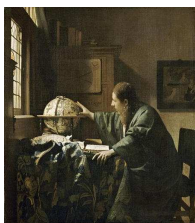
Vermeer Johannes, L'astrologue dit aussi L'astronome , 1668, peinture à l'huile sur toile, 51.5 H, 45.5 L, musée du Louvre - département des Peintures, Paris.

Auteur, titre en italique , date, nature de l'œuvre (huile sur toile, œuvre romaine d'époque impériale d'après un original en bronze...), dimensions si possible, lieu de conservation (musée du Louvre...), ville.